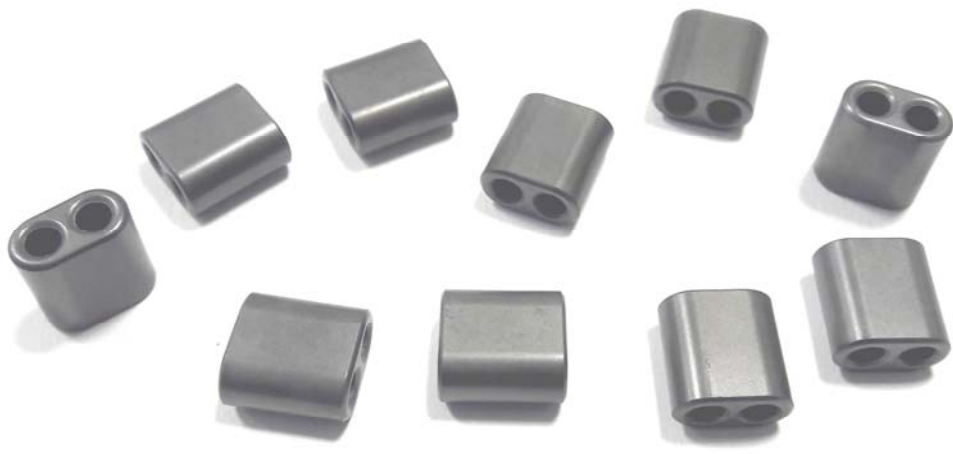
MFB-0380 제품사진 / (10개 단위로 포장 판매)

이 제품은 부하(전자기기)와 전력선통신 라인 사이에 장착하여 사용하는 제품으로 부하에서 발생하는 노이즈를 감소시키는 효과 및 부하의 임피던스를 높여 주어 안정적인 전력선통신을 가능하게 해 주는 제품으로 전선에 직접 장착하는 형태라 설치가 쉽고 안전하며, 2.5SQ 이하 의 전선에 사용 가능하다.