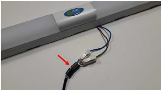
(부하에 장착) 부하(전등)를 블로킹