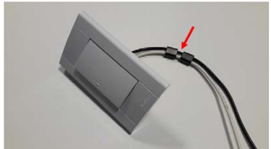
(스위치에 장착) 스위치에 연결된 부하를 블로킹