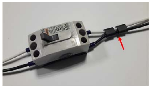
(누전차단기에 장착) 누전차단기에 연결된 부하를 블로킹